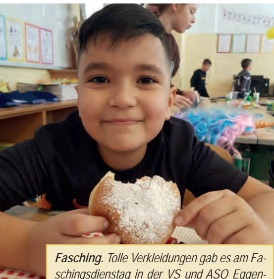
Fasching. Tolle Verkleidungen gab es am Faschingsdienstag in der VS und ASO Eggendorf zu bewundern. Faschingsspiele und Faschingskrapfen – danke an den Elternverein für diese Jause – machten den Tag zu einem besonderen Erlebnis für die Kinder.