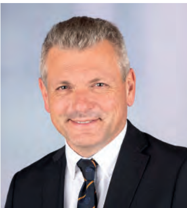
DI FELIX RUPP VIZEBÜRGERMEISTER