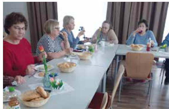
Senioren Aktiv Eggendorf-Ort. Fasching wird auch gerne bei unseren Bewohner/innen im Betreuerbaren Wohnen in der Josef-Nachtigall-Gasse gefeiert, hier kommen Spaß und Lebensfreude nie zu kurz. Auch der selbstgemachte Heringschmaus wurde gemeinsam genossen.